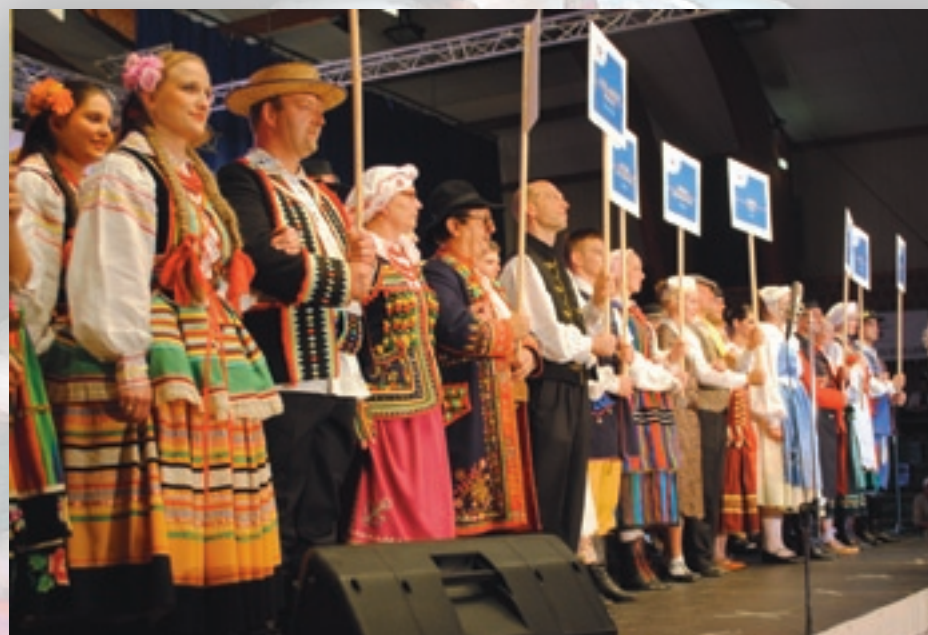
► Entrée des groupes et début du spectacle.