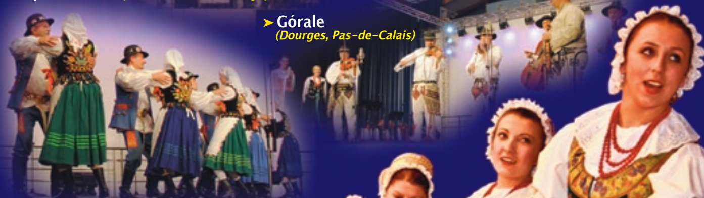
➤ Górale (Douges, Pas-de-Calais)