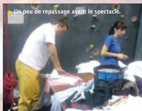
► Un peu de repassage avant le spectacle.