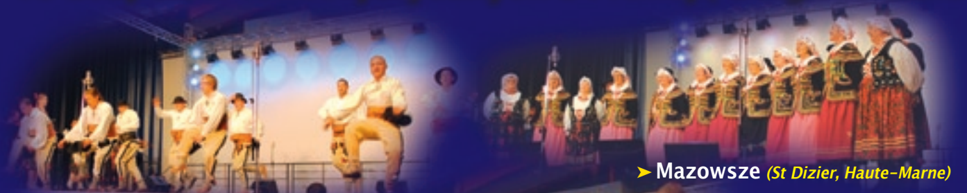
➤ Mazowsze (St Dizier, Haute-Marne)

GRAND GALA DE FOLKLORE POLONAIS / WIELKA GALA FOLKLORU POLSKIEGO Hénin-Beaumont / 30 octobre 2010 / 30 października 2010 10 zespołów folklorystycznych z Francji, Belgii i Polski