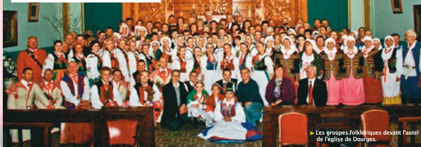
► Les groupes folkloriques devant l'autel de l'église de Dourges.

Le Gala de folklore polonais "Polska'dance" a été un événement marquant pour la communauté d'origine polonaise, en particulier pour les groupes folkloriques qui se sont concertés pour présenter un magnifique spectacle de chants et de danses des régions de Pologne.