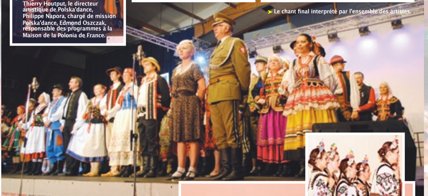
► Le chant final interprété par l'ensemble des artistes.