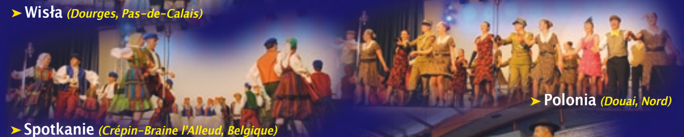
➤ Spotkanie (Crépin-Braine l'Alleud, Belgique)