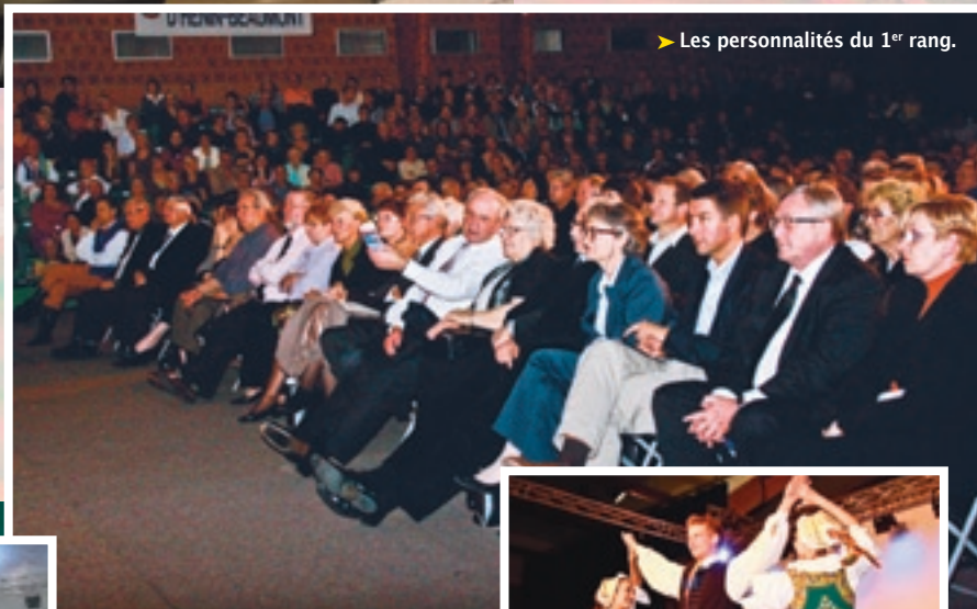
► Les personnalités du 1 er rang.