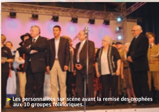
► Les personnalités sur scène avant la remise des trophées aux 10 groupes folkloriques.